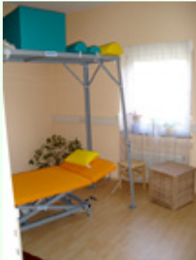
Behandlungsraum 3 / Schlingentisch