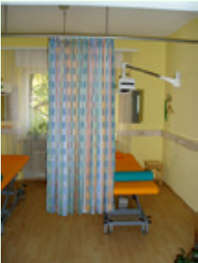
Behandlungsraum 1 / Massagekabinen